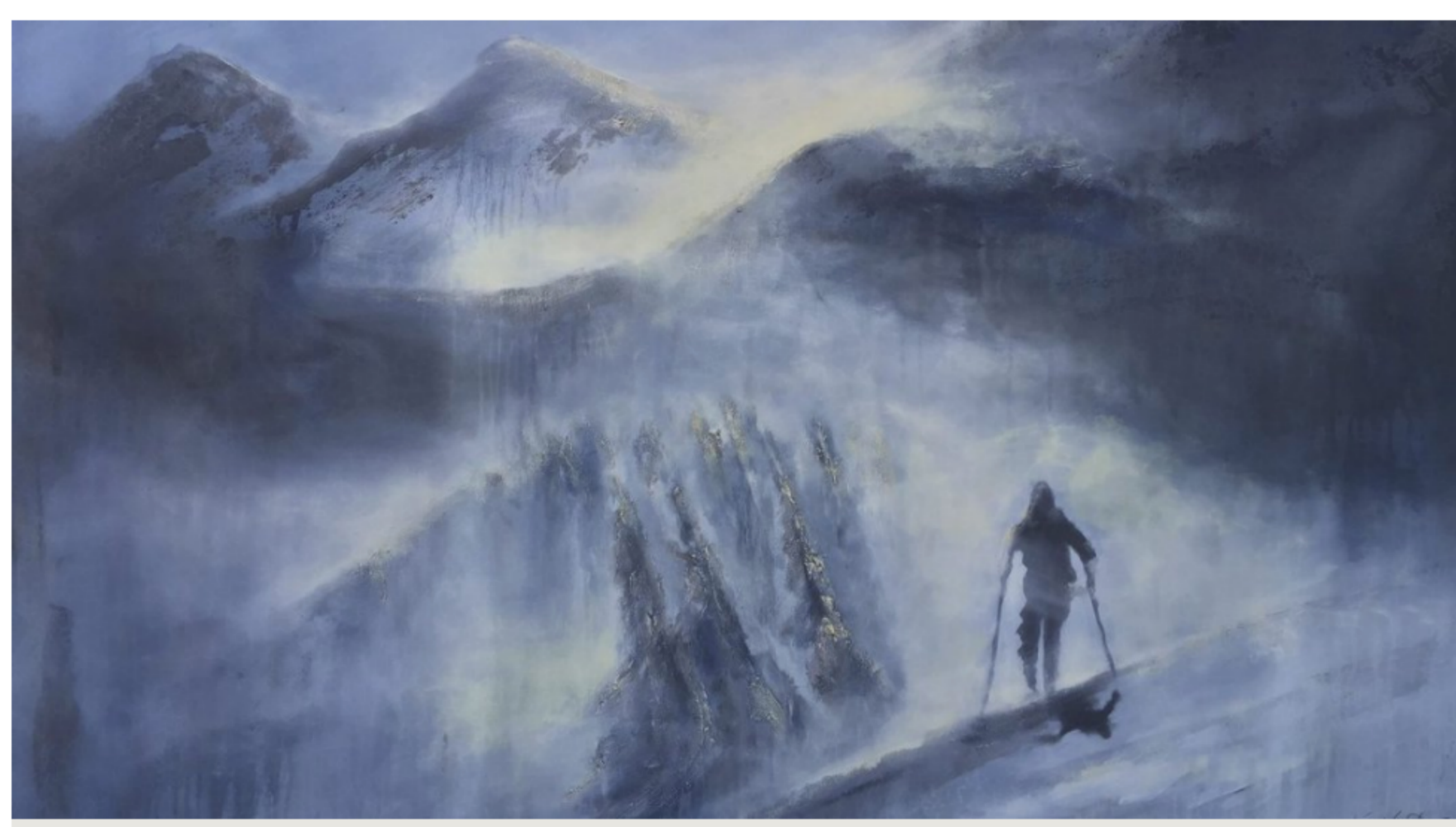
Stemming: Landskap å drømme seg bort i, med «Blå skitur».

I tillegg til utstillingene har hun et samarbeidsprosjekt med et norsk klesfirma gående, de skal lage noen produkter med hennes malerier som motiver.