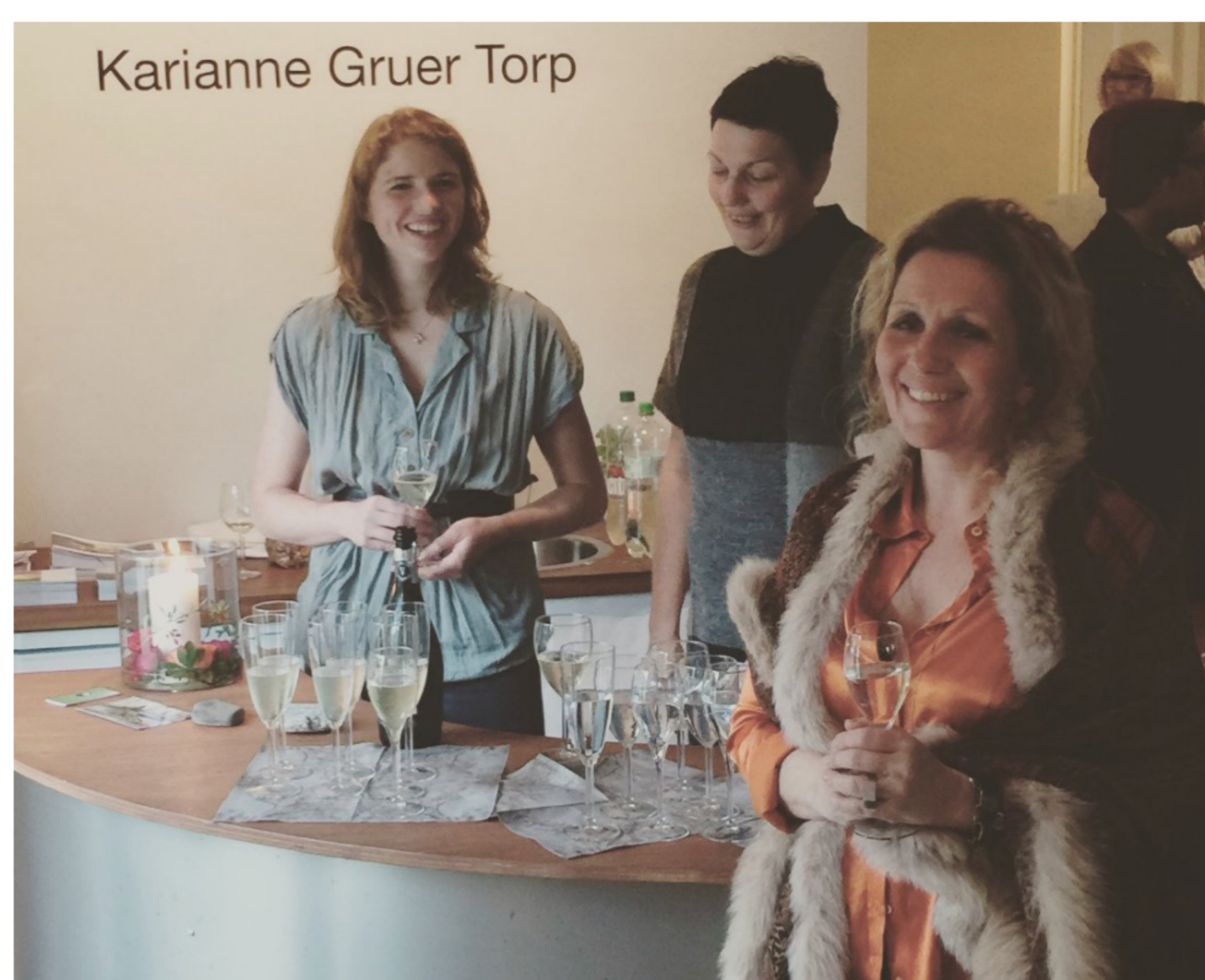
Glimt fra vernissage til åpningen av "Fjord og fjell", på Hole Art Center.

Hun er svært fornøyd med progresjon i egen kunstnerkarriere.