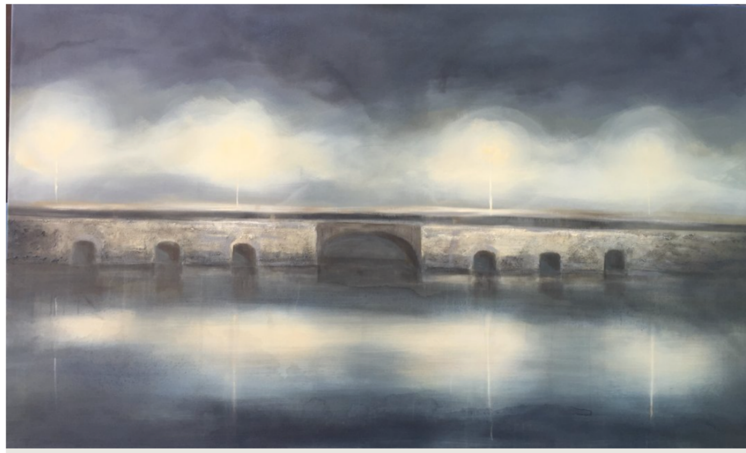
Utsnitt av maleriet "Kroksund Bro".

Den bergtatte damen mener det er umulig å bli lei av fjell.